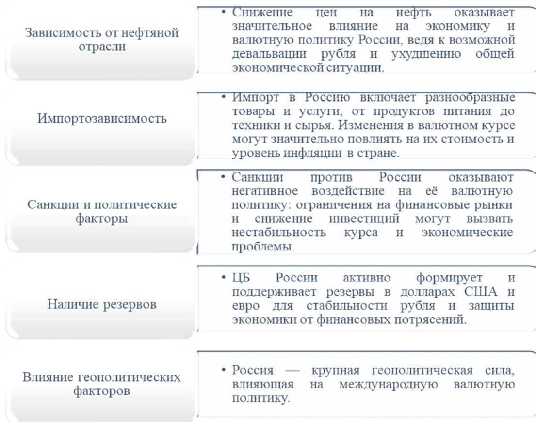
Рисунок 2 — Особенности валютной политики России

Также были внесены изменения в ФЗ «О валютном регулировании и валютном контроле», которые коснулись усовершенствования механизма валютного контроля [4].