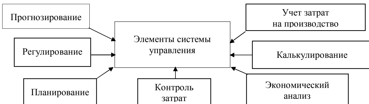
Рисунок 2 — Основные элементы системы управления затратами

Такой механизм имеет сложную внутреннюю структуру, обусловленную: разнообразием функций управления в целом; диверсификацией функций управления затратами как специфического объекта в общей системе управления деятельностью предприятия; наличием организационной и информационной инфраструктуры управления затратами; совокупностью конкретных методов управления; наличием сферы государственно-нормативного и правового регулирования деятельности предприятия. Управление затратами является неотъемлемой частью процесса управления предприятием и включает основные элементы общей системы управления, которые представлены на рисунке 2.