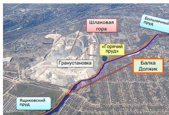
Рисунок 1 — Взаимное расположение отвала доменных шлаков и водоемов по водотоку балки Должик

На снимке отчетливо видны грануляционная установка, грейдеры, «горячий пруд» и др. Движение водотока по балке Должик происходит в направлении уклона от Ящиковского пруда до Больничного пруда.