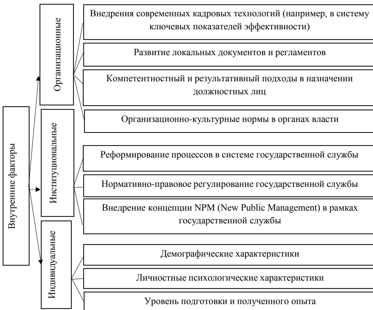
Рис. 2. Классификация внутренних факторов, влияющих на качество государственного управления и эффективность труда государственных служащих ЛНР

стратегического уровня и учитываются при разработке концепции и стратегии развития государственной гражданской службы.