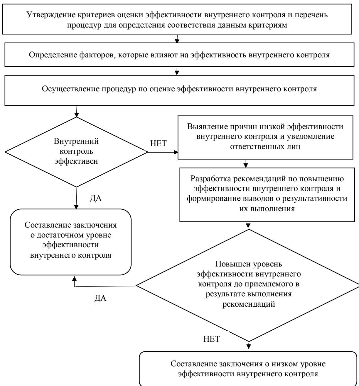
Рисунок 2 Алгоритм оценивания эффективности внутреннего контроля

Выводы и направление дальнейших исследований. Основной задачей внутреннего контроля является защита имущественных законных интересов организации и его собственников, а также снижение финансовых затрат, возникающих по разным причинам. Не каждому субъекту хозяйствования удаётся внедрить систему внутреннего контроля самостоятельно, так