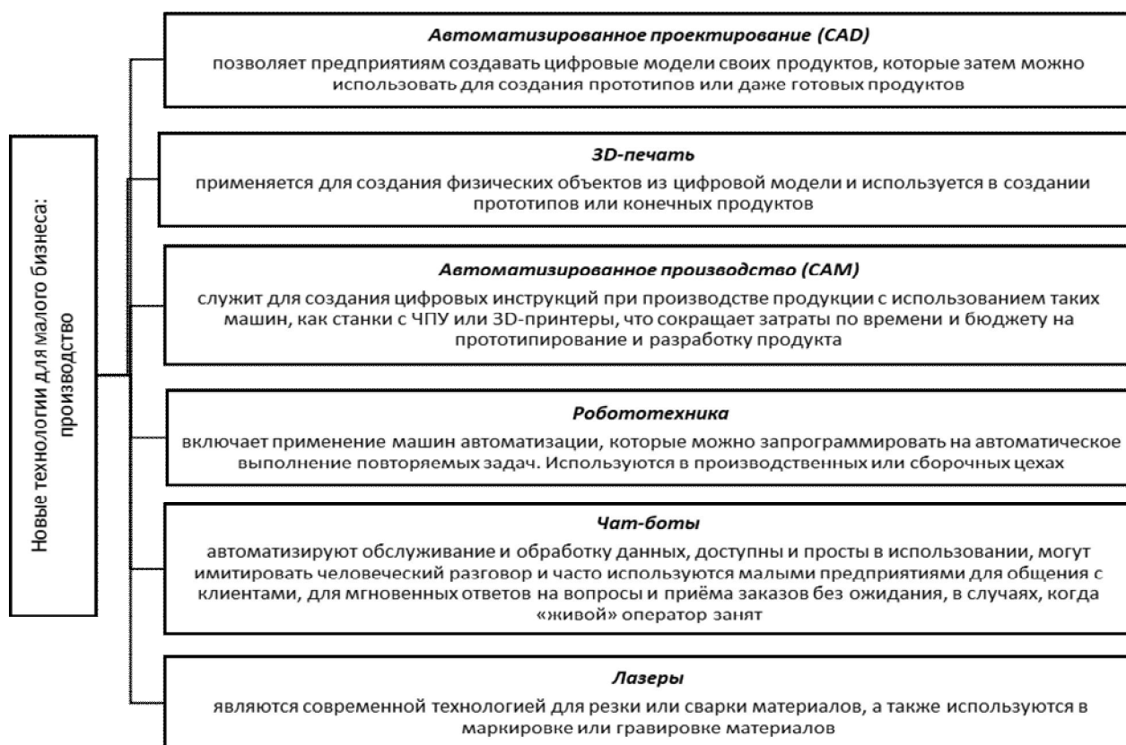
Рисунок 1 — Новые технологии для малого бизнеса в производстве

Новые информационные технологии (далее — ИТ) для малого бизнеса в производстве, представленные на рисунке 1, дают возможность предпринимателям более эффективно управлять небольшими предприятиями, производить продукцию быстрее и с меньшими издержками, что ведет к повышению конкурентоспособности, а также созданию нестандартных продуктов с меньшими затратами, чем у других компаний. Два ключевых преимущества использования высокотехнологичных решений при управлении производством — это гибкость инструментария и точечный контроль над бизнес-операциями.