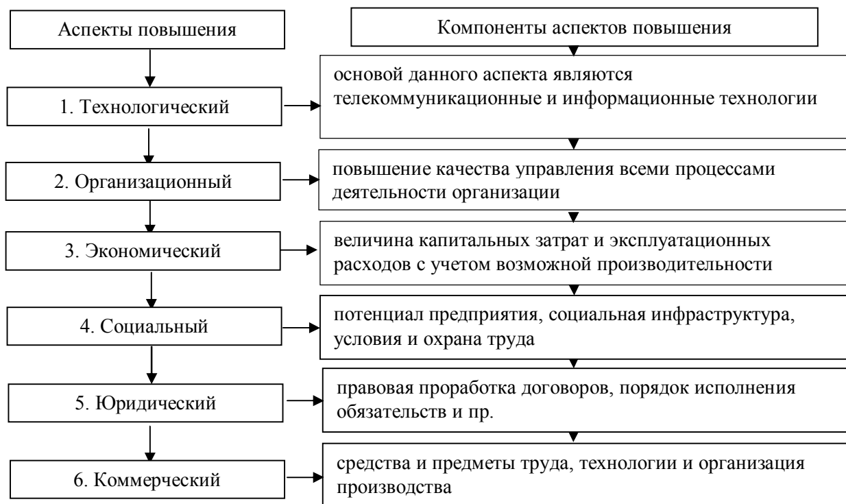
Рисунок 2 — Основные аспекты повышения конкурентоспособности предприятия