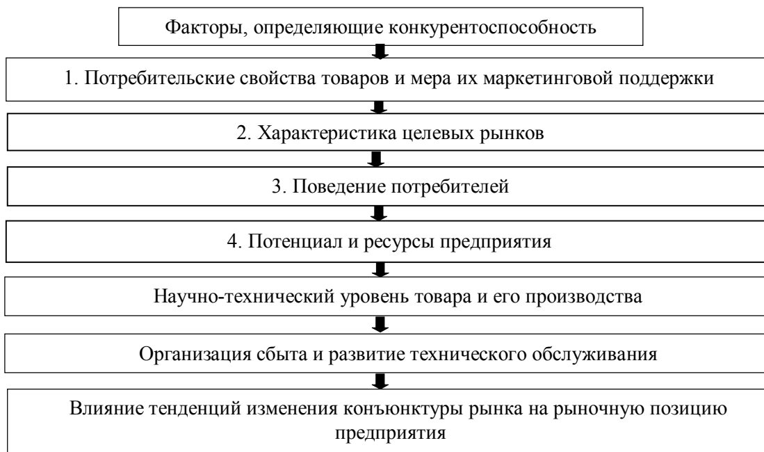
Рисунок 4 — Факторы, определяющие конкурентоспособность предприятия

Влияние основных факторов на конкурентоспособность предприятия определить сложно, поэтому нельзя предложить единую методику сбора данных относительно их обработки и идентификации для принятия соответствующих решений. На основе рассмотренных проблем, предложим направления их решения (рис. 5).