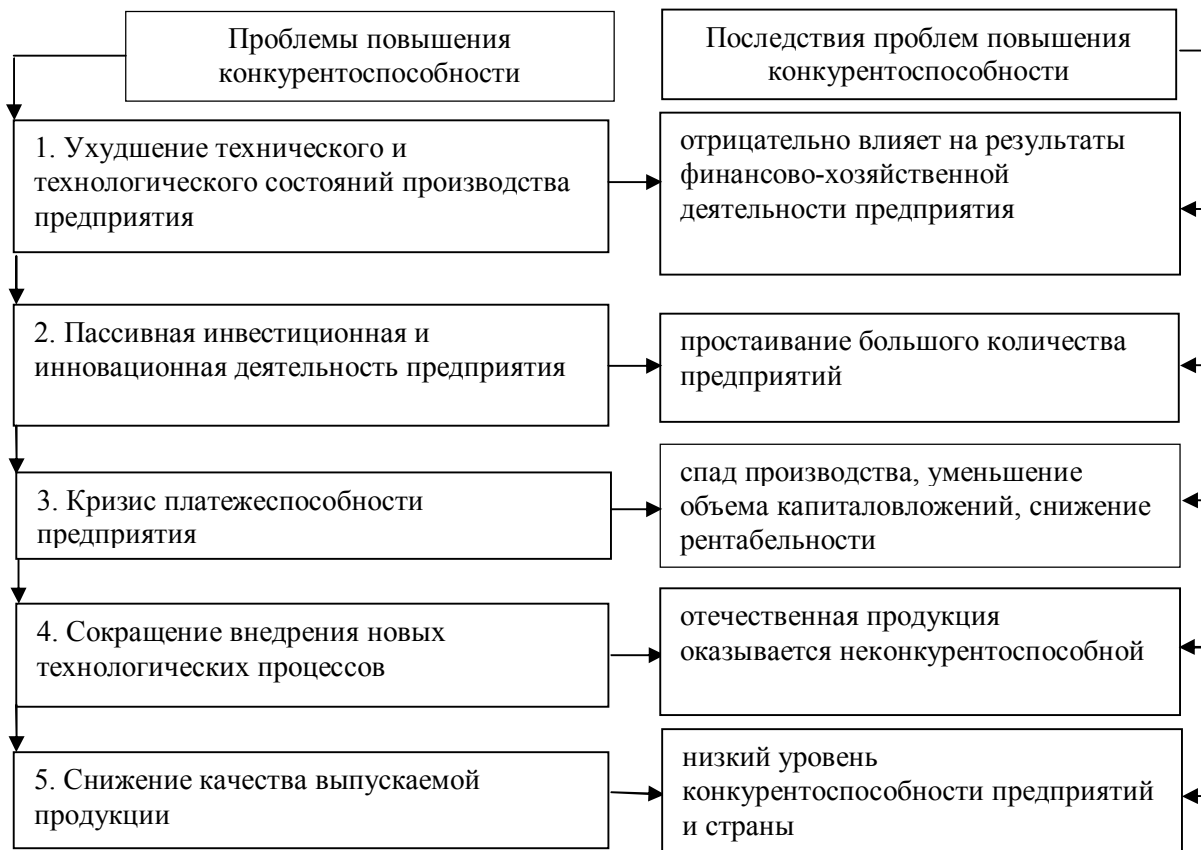
Рисунок 1 — Основные проблемы повышения конкурентоспособности предприятия

Повышение конкурентоспособности предприятия необходимо рассматривать как последовательный процесс поиска и реализации управленческих решений во всех сферах его деятельности, осуществляемый в соответствии с выбранной стратегией развития и состояния денежных средств предприятия, с последующим внесением корректив.