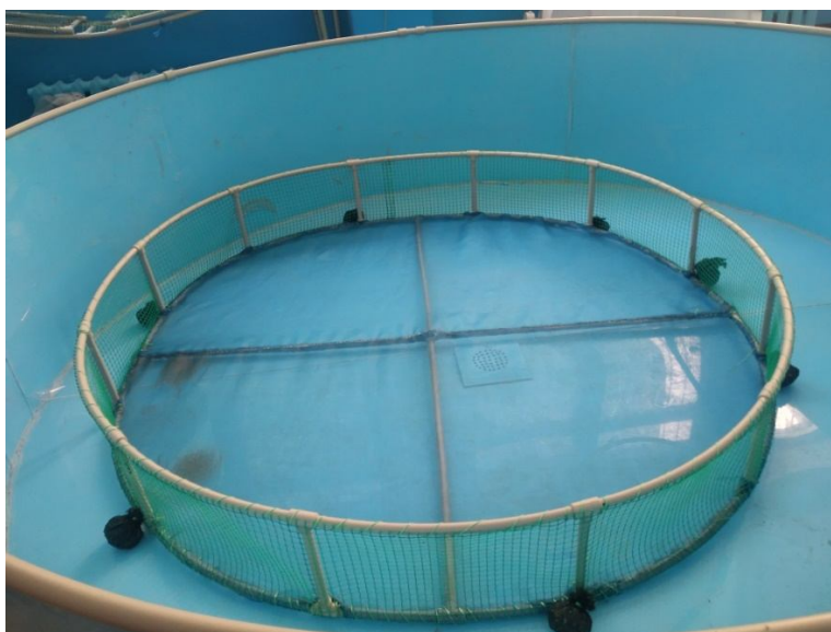
Рисунок 6 Садок для бассейна УЗВ

Каркас изготовлен из пластиковых труб \varnothing=20 мм. Стенки обтянуты пластиковой садовой решеткой с ячейей 10\times 10 мм. Дно обтянуто капроновой сеткой с ячейей \varnothing=0,1 мм. Для предотвращения всплытия садка трубы каркаса заполнены песком, к каркасу прикреплены грузила из камней.