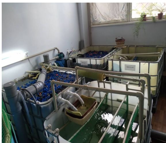
Рисунок 3 Комплекс очистки воды в УЗВ цеха выращивания товарной рыбы