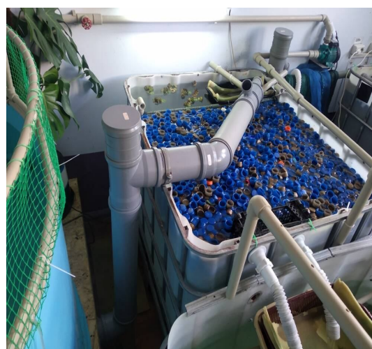
Рисунок 2 Система сброса оборотной воды из бассейнов с рыбой на очистку в цехе выращивания товарной рыбы