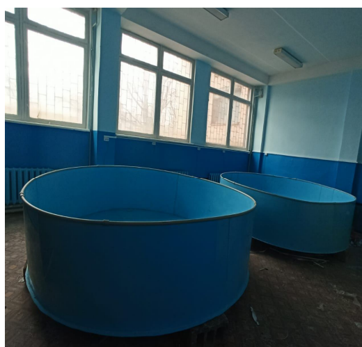
Рисунок 1 Бассейны УЗВ цеха выращивания товарной рыбы