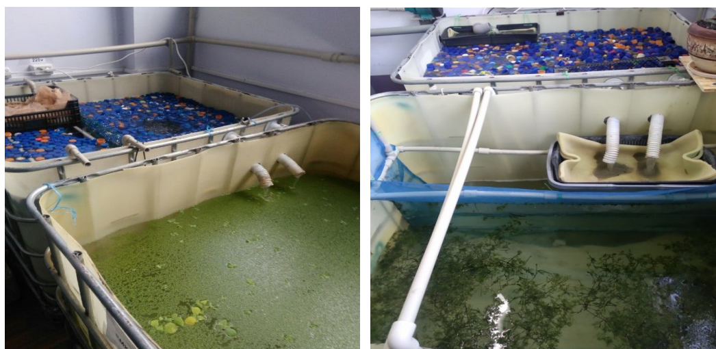
Рисунок 4 Биофильтры и биоплато в УЗВ цеха выращивания товарной рыбы