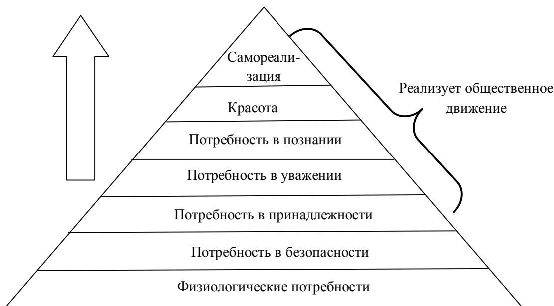
Рисунок 2 Связь пирамиды потребностей Маслоу с реализацией потребностей Общественным движением (предложено авторами)

Для успешной и слаженной работы, результатом которой станет не только достижение поставленных движением целей, но и удовлетворение столь многих потребностей общества, в обязательном порядке необходимо наличие четкой структуры.