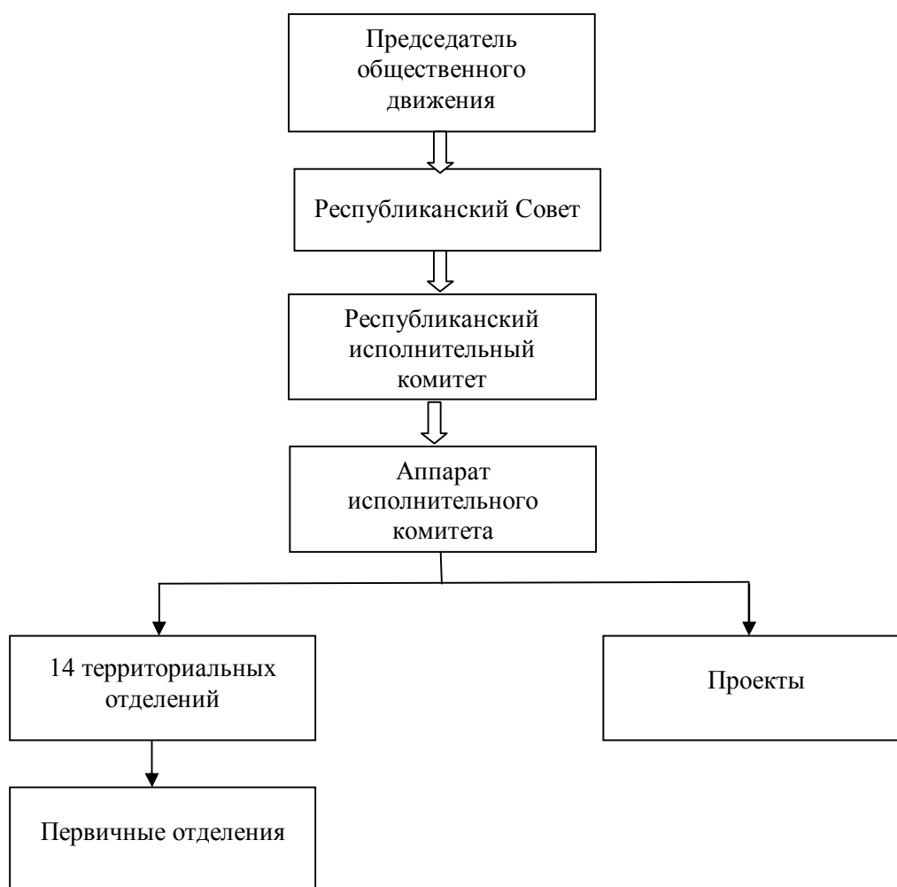
Рисунок 3 Структура общественного движения «Мир Луганщине»

В каждом территориальном отделении выделяют руководителя и председателя, координирующих проведение работ непосредственно в пределах города. У каждого первичного отделения также выделяются председатели первичных отделений. Первичные отделения необходимы для разделения всех участников движения на территориях на категории по различным признакам, например: ветераны, молодежь и т. д. Такое разделение призвано упростить и структурировать работу территориального отделения по сбору актива или выполнению распоряжений. Подробная структура территориальных отделений представлена на рисунке 4 [5].