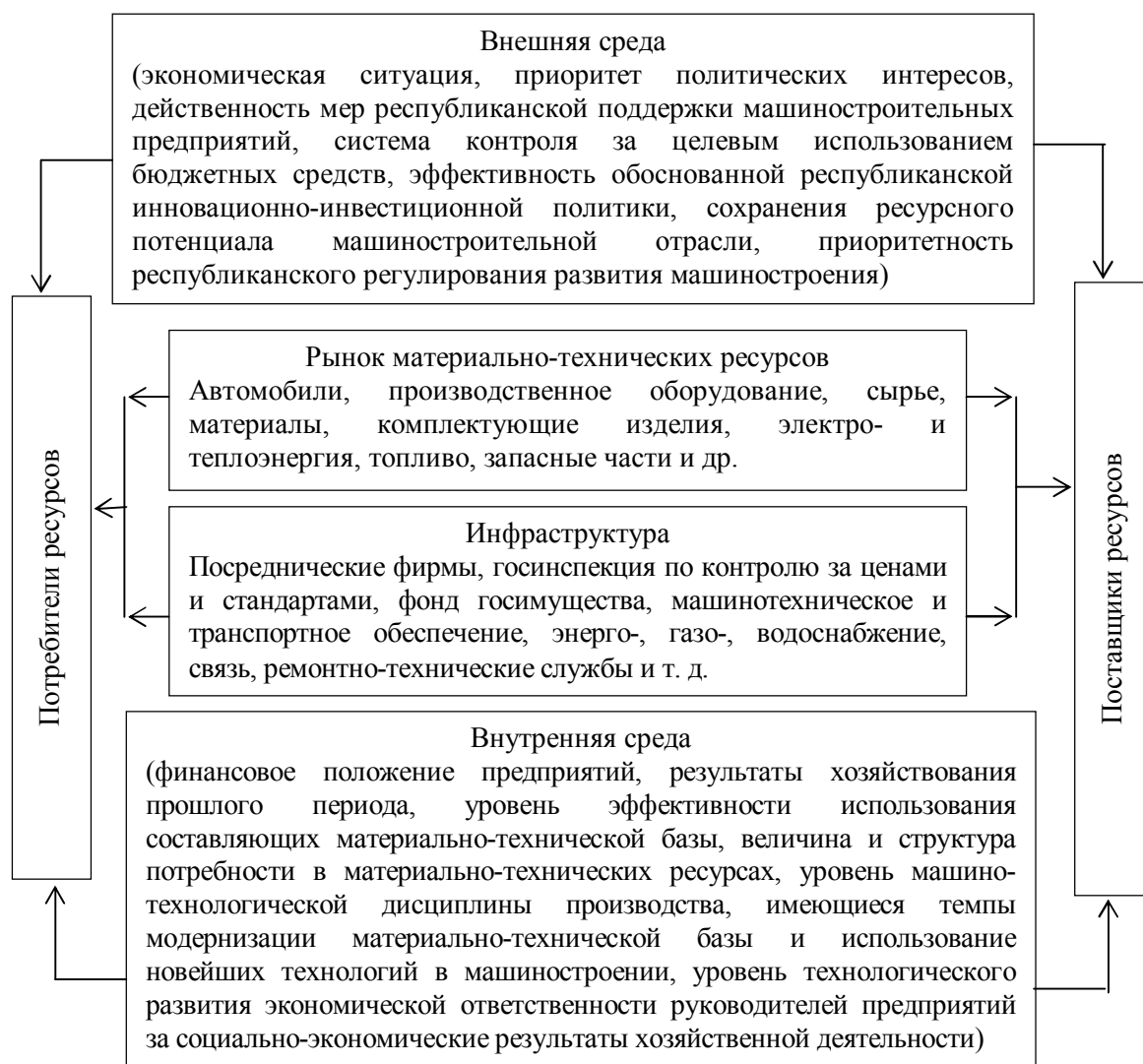
Рисунок 1 Функционирование и взаимосвязь элементов системы материально-технического обеспечения машиностроения

5) своевременности расчетов между участниками рынка материально-технических средств.