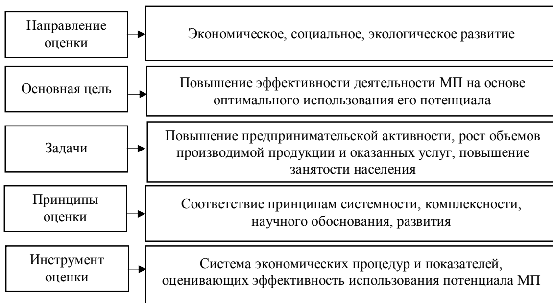
Рисунок 2 Процессный подход к оценке потенциала МП как фактора устойчивого экономического развития

Следовательно, учитывая вышеизложенное, нами сформирован и предложен процессный подход к оценке потенциала малого предпринимательства как фактора устойчивого экономического роста (рис. 2).