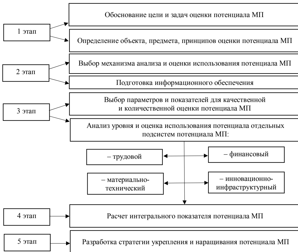
Рисунок 3 Основные этапы оценки потенциала малого предпринимательства

Как уже было отмечено, одной из наиболее важных составляющих методологии является методика исследования предпринимательского потенциала. Результаты анализа существующих методик позволили предложить алгоритм оценки использования потенциала малого предпринимательства, под которым понимается последовательность управленческих решений относительно оценки его состояния, структуры, уровня использования. Считаем, что такой методический подход к оценке потенциала малого предпринимательства должен включать в себя ряд этапов, отражающих последовательность действий, начиная с обоснования целей и задач оценки до формирования стратегии его укрепления и наращивания (рис. 3).