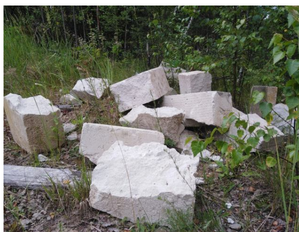
Рисунок 2 Строительный мусор

Анализ ситуации показывает, что обычными запретительными мерами ее решение невозможно, так как не налажен самый главный принцип утилизации подобного мусора — его переработка. А отсутствие правильного и эффективного экологического воспитания или формализм в этом направлении не дает каких-либо значимых результатов.