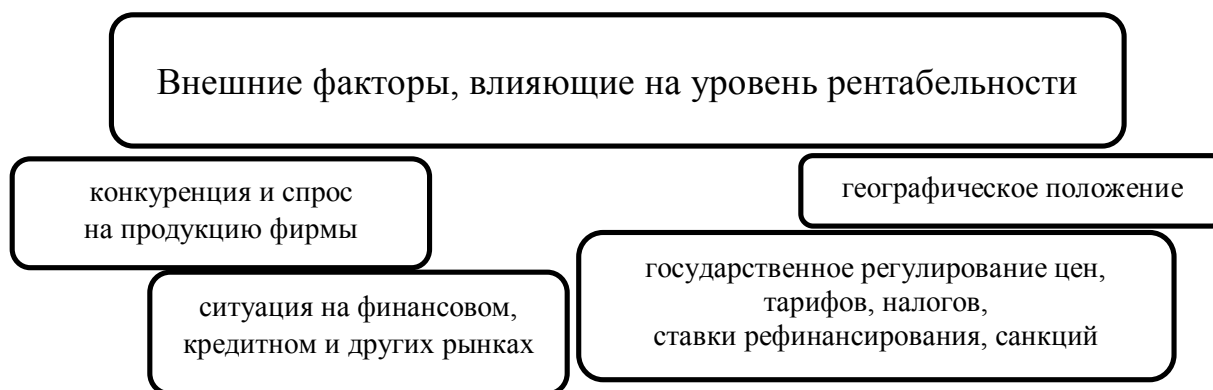
Рисунок 2 Внешние факторы влияния на рентабельность производства

Поиск резервов для снижения объема затрат на производство и реализацию продукции и резервов для роста финансовых поступлений от реализации являются наиболее целесообразными способами повышения общей рентабельности на предприятии [5].