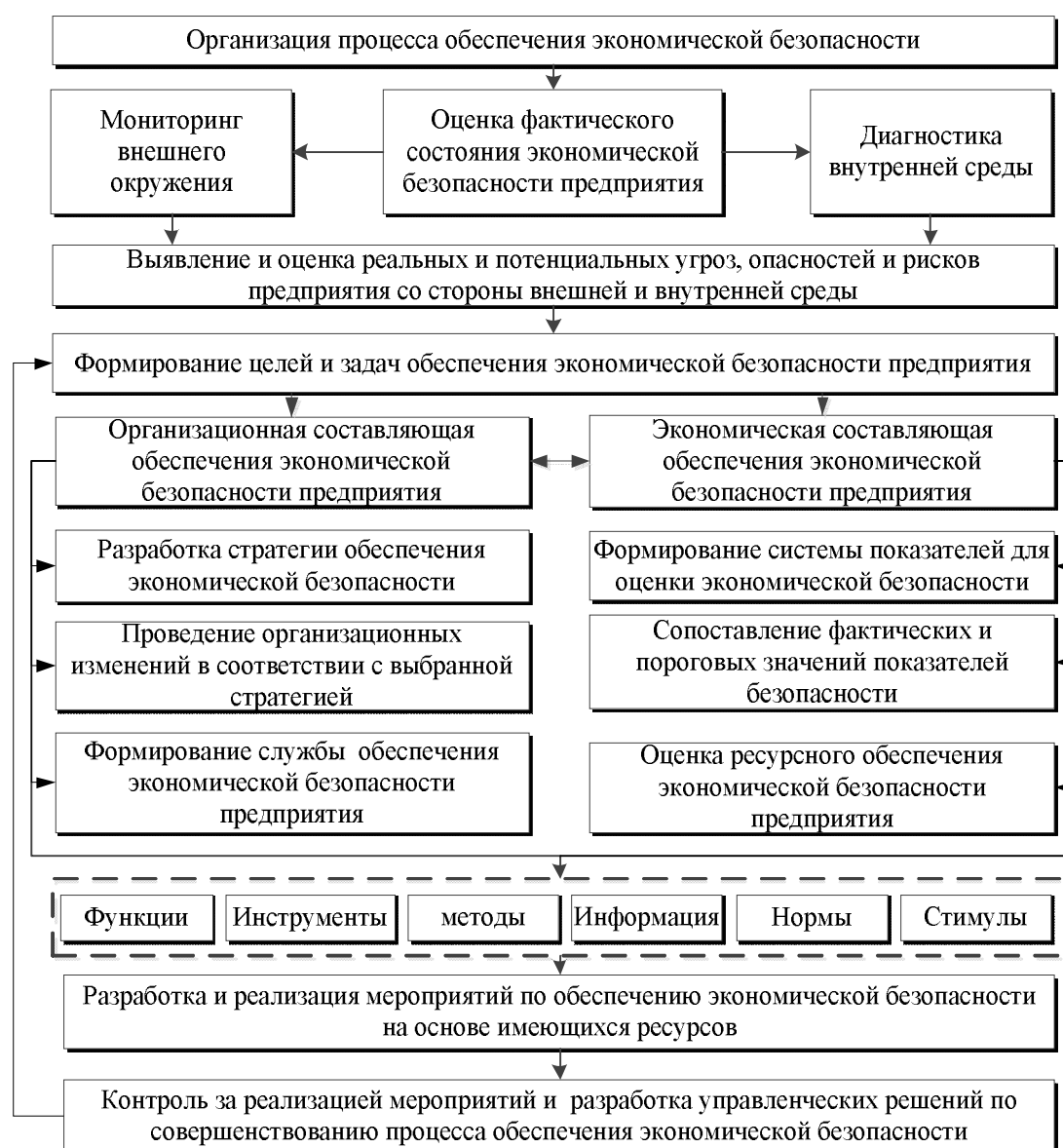
Рисунок 1 Алгоритм организационно-экономического механизма обеспечения экономической безопасности предприятия

Организационная составляющая предусматривает разработку соответствующей стратегии обеспечения экономической безопасности, проведение изменений и формирование структуры предприятия в соответствии с выбранной стратегией. При этом в структуре предприятия, в зависимости от сложности решаемых задач и его масштабов, формируется структурное подразделение, отвечающее за экономическую безопасность. Экономическая составляющая осуществляет экономическую