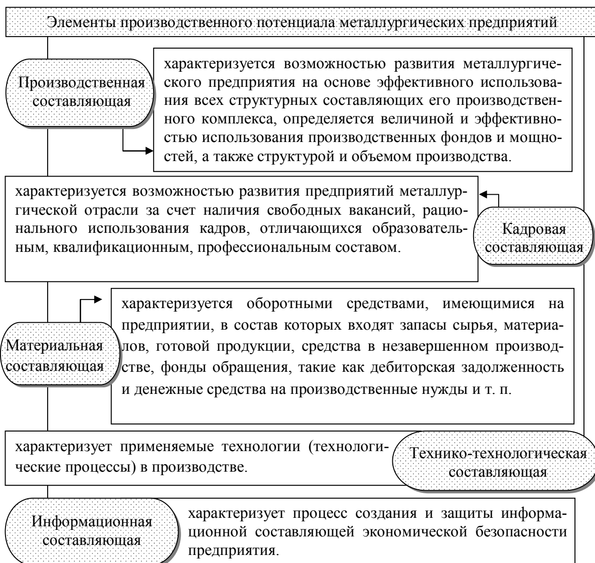
Рисунок 1 Элементы производственного потенциала предприятий металлургической отрасли

С помощью многофакторного корреляционно-регрессионного анализа применимого к металлургической отрасли первостепенным является выявление наиболее важных признаков-факторов, способствующих количественно оценить степень их влияния на результат (как в совокупности, так и по отдельности) и как следствие выявить эффективность металлопроизводства [6].