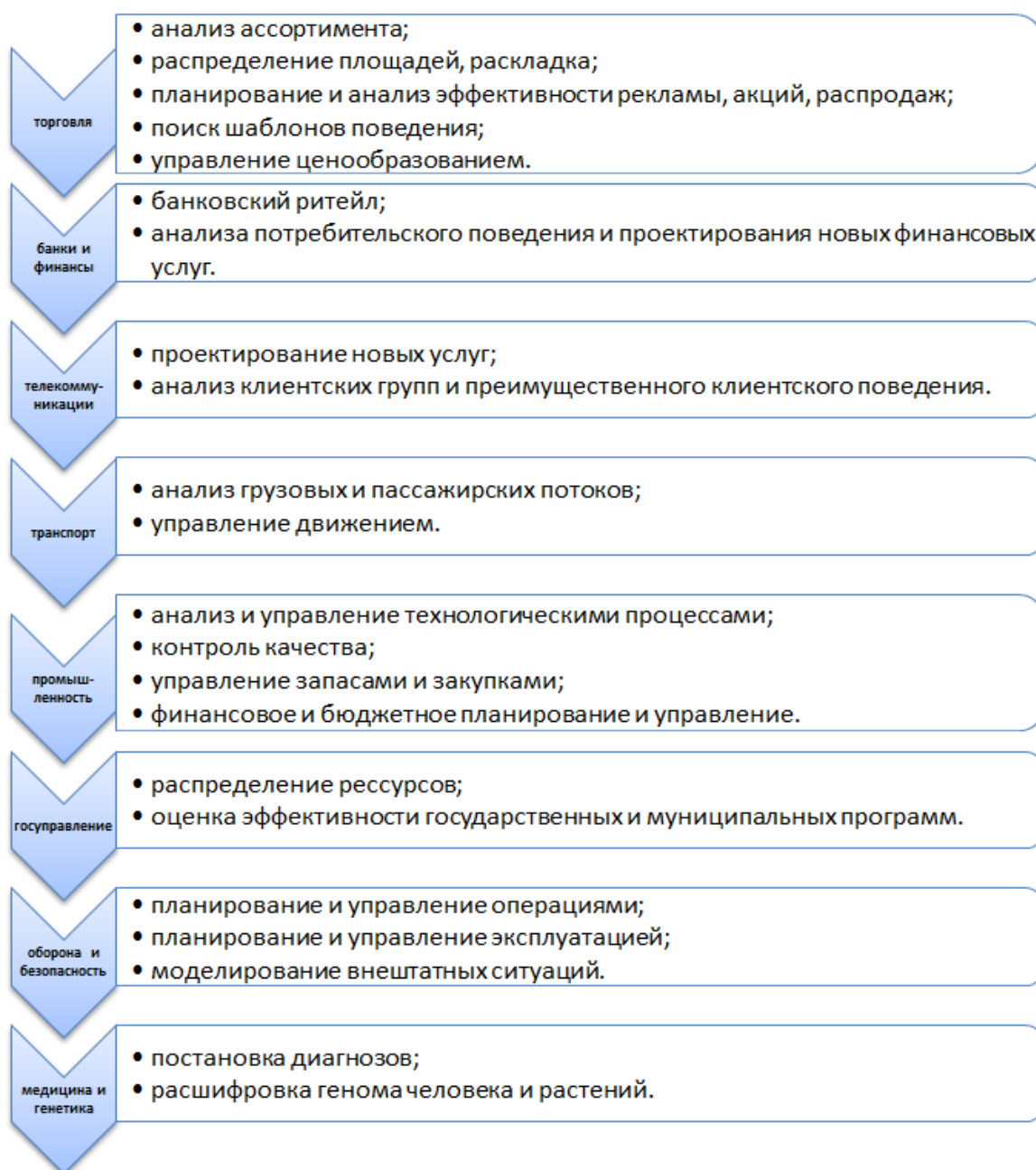
Рисунок 1 Использование СППР в различных отраслях экономики

В литературе представлено множество вариантов классификации СППР. После обобщения и систематизации классификация СППР представлена на рисунке 2. СППР предложено классифицировать по назначению, взаимодействию с пользователем, способам поддержки, сфере использования и типу решаемых задач.