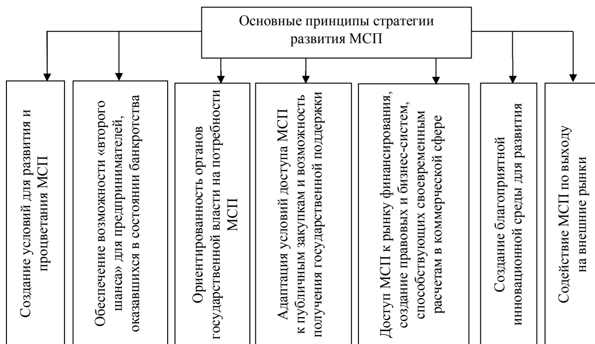
Рисунок 3 Основные принципы стратегии развития МСП