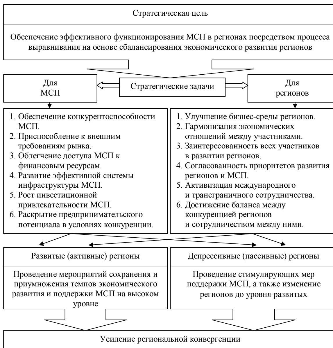
Рисунок 4 Концепция стратегических принципов выравнивания экономического развития МСП

Активные регионы занимают передовое место среди регионального распределения МСП по видам экономической деятельности. Преобладающей сферой экономической деятельности является промышленность.