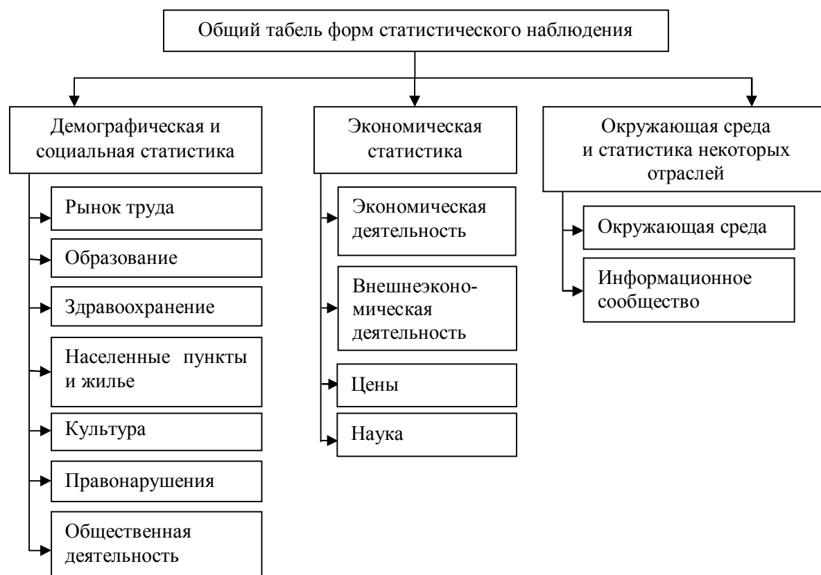
Рисунок 2 Структурно-логическая схема состава форм статистического наблюдения согласно приказу Госкомстата ЛНР

Реализация государственного статистического наблюдения в РФ возложена на Федеральную службу государственной статистики (далее — Росстат).