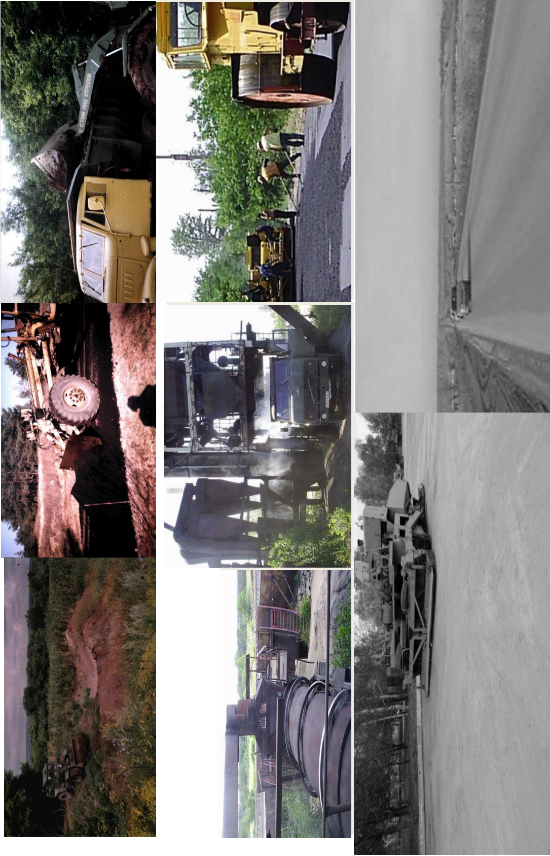
Рисунок 2 – Основные этапы утилизации ОСВ в дорожном строительстве