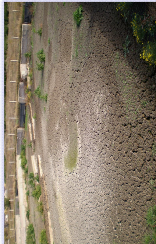
Рисунок 1 – Виды исходных отходов