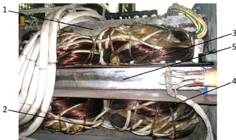
Рисунок 1 – Экспериментальный образец ЭМД: 1, 2 – индукторы бегущего поля; 3, 4 – трехфазные обмотки; 5 – рабочая камера.

Изложение материала и его результаты. Для решения поставленной задачи был использован экспериментальный образец ЭМД (рисунок 1), изготовленный в Физико-технологическом институте металлов и сплавов НАН Украины, на базе которого и проводились исследования.